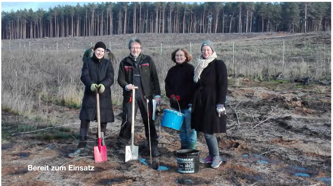
Bereit zum Einsatz