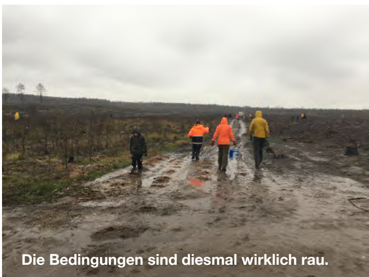
Die Bedingungen sind diesmal wirklich rau.