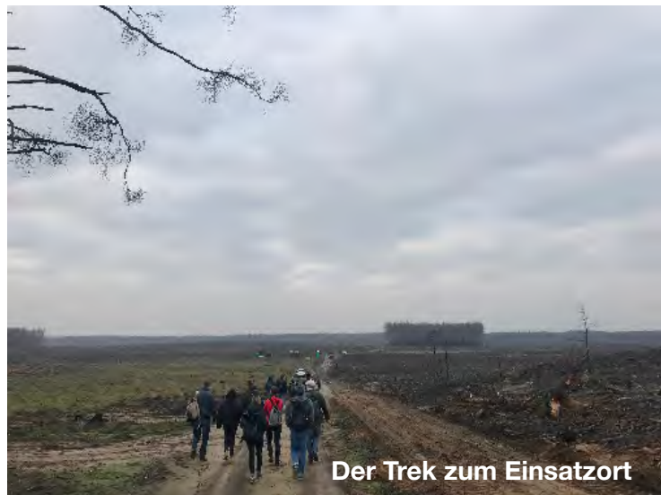
Der Trek zum Einsatzort