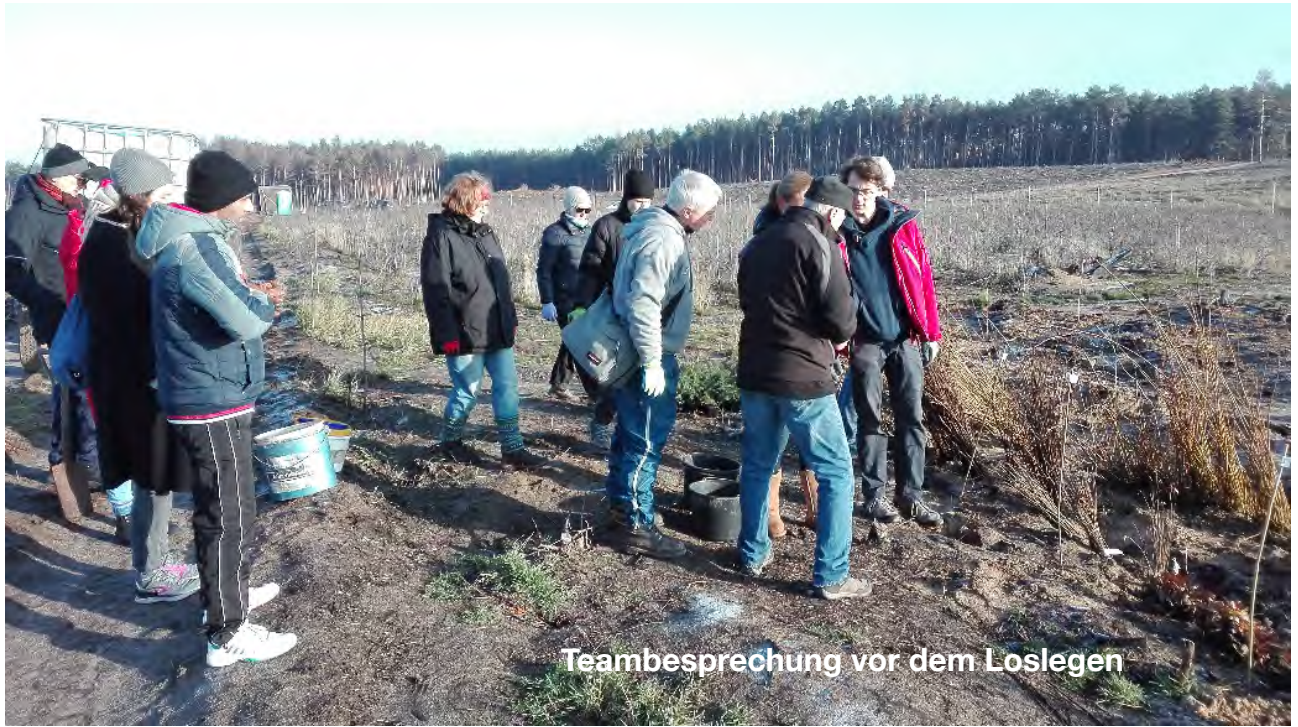
Teambesprechung vor dem Loslegen