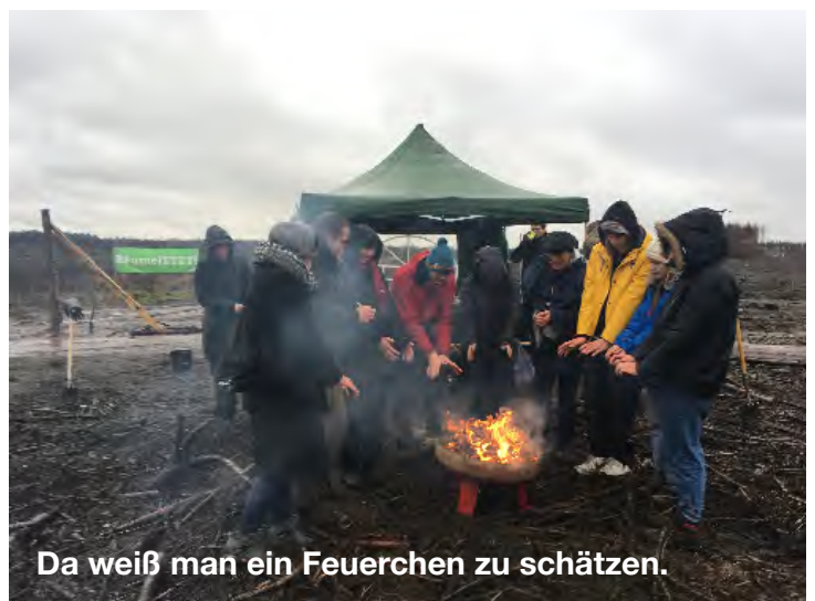
Da weiß man ein Feuerchen zu schätzen.