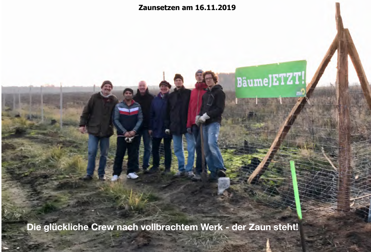
Die glückliche Crew nach vollbrachtem Werk - der Zaun steht!