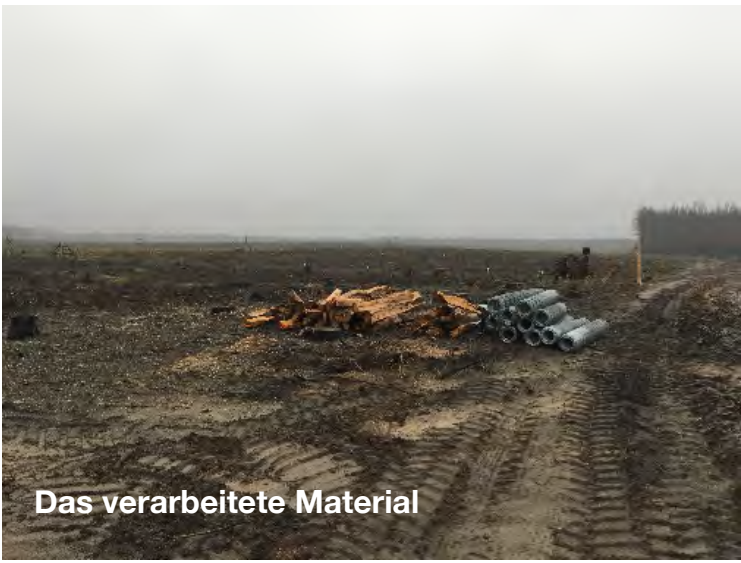
Das verarbeitete Material