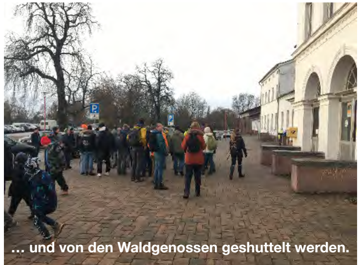
... und von den Waldgenossen geschüttelt werden.