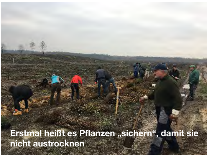
Erstmal heißt es Pflanzen „sichern“, damit sie nicht austrocknen