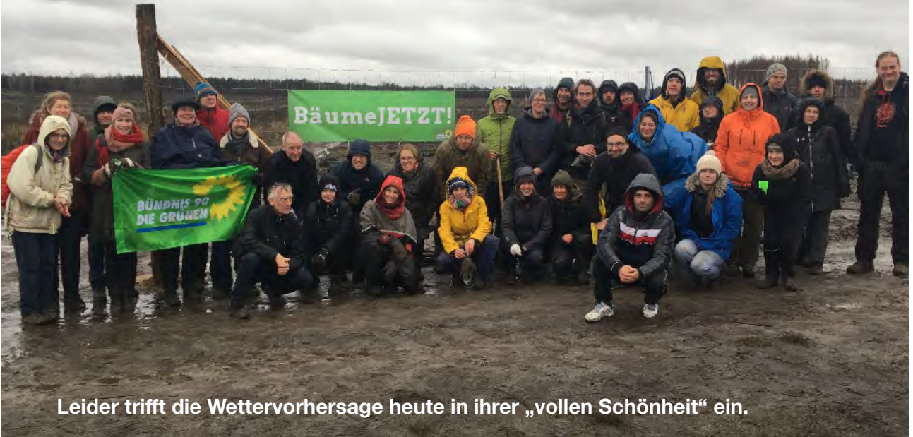
Leider trifft die Wettervorhersage heute in ihrer „vollen Schönheit“ ein.