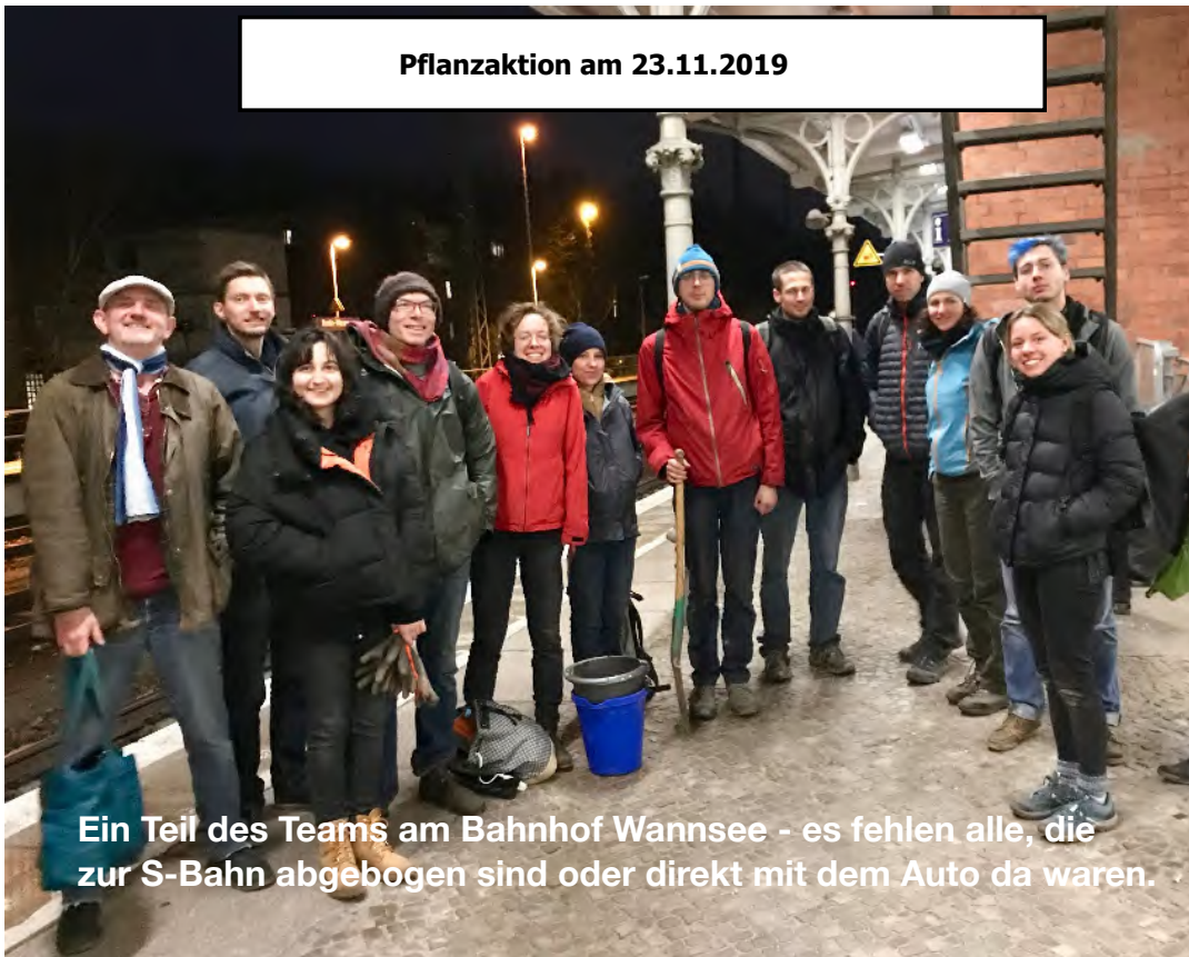
Ein Teil des Teams am Bahnhof Wannsee - es fehlen alle, die zur S-Bahn abgelenkt sind oder direkt mit dem Auto da waren.