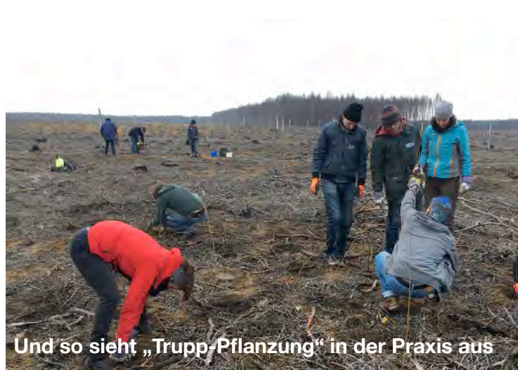
Und so sieht „Trupp-Pflanzung“ in der Praxis aus