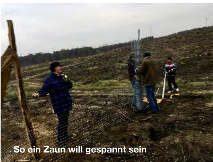
So ein Zaun will gespannt sein