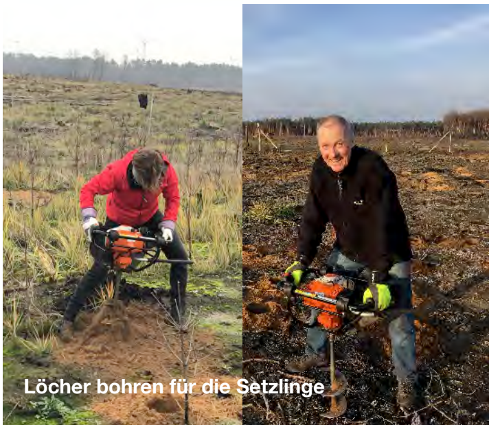
Löcher bohren für die Setzlinge