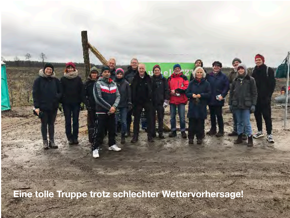
Eine tolle Truppe trotz schlechter Wettervorhersage!