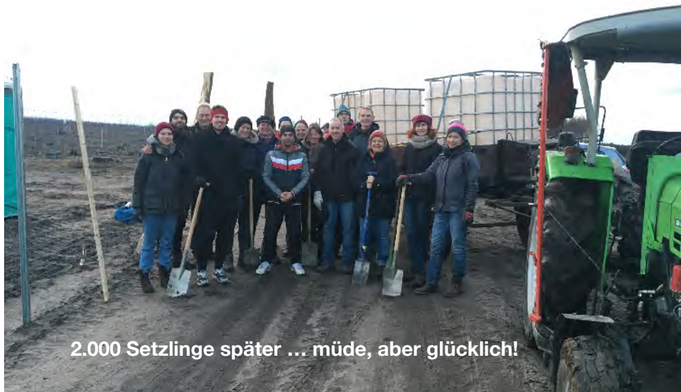
2.000 Setzlinge später ... müde, aber glücklich!