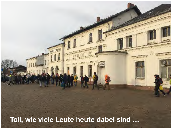
Toll, wie viele Leute heute dabei sind ...